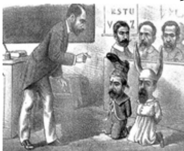
Figura 7: Caricatura de José Gálvez. El Mosquito , 6/4/1890

Para finalizar, quisiéramos esbozar algunas reflexiones respecto de Gálvez que se desprenden de la comparación con otras caricaturas de personalidades políticas. En las ilustraciones del periodismo porteño, al igual que otros referentes del autonomismo sospechados de corrupción —como Juárez Celman, representado en más de una oportunidad con orejas de burro y bolsas de dinero en sus manos—, la figura de Gálvez fue deformada colocándosele elementos o frases que lo identificaban con la mala administración y el enriquecimiento personal —véase figura 7— (Dell’Acqua, 1960, pp. 62-63). Por otro lado, la prensa rosarina publicó textos de opinión que ponían en duda —de manera sagaz— las cualidades políticas del gobernador pero las caricaturas divulgadas, tanto por el periodismo opositor como oficialista, no parodiaban su figura.