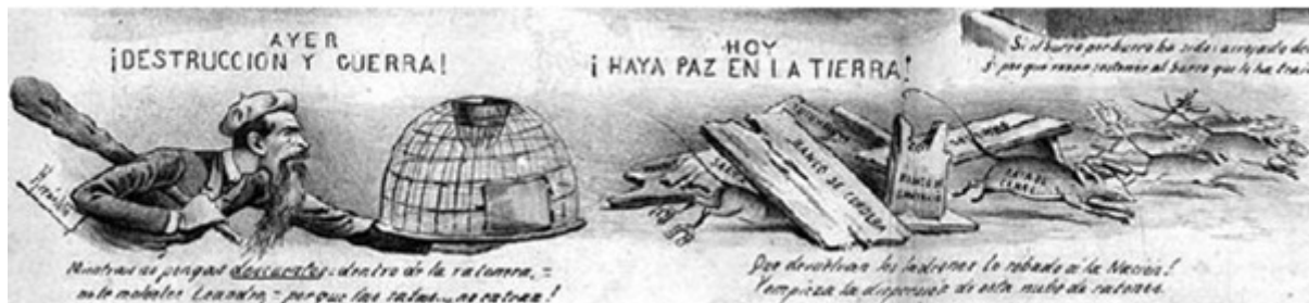
Figura 1: Imagen de Leandro Alem. Don Quijote , 26/10/1890

Por otra parte, observamos en el discurso periodístico la utilización del término corrupción con una connotación diferente. En una noticia publicada por Don Quijote , que refería a una manifestación cívica erigida en contra de los abusos bancarios, se expresaba: