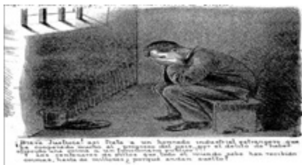
Figura 2: Empresario encarcelado. El Mosquito , 28/11/ 1890

No sólo Don Quijote expresó estos valores: su par El Mosquito también se refirió a esta sensación de vergüenza que imperaba en buena parte del empresariado, partícipes de los malos manejos en las entidades bancarias y ligados a los negocios estatales. La siguiente imagen publicada por El Mosquito es ilustrativa al respecto. En ella se observa la pesadumbre de un empresario encarcelado por haber pagado coimas a funcionarios estatales.