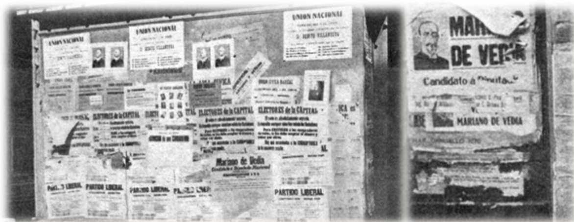
Fotografías publicadas en Caras y Caretas , 1912. (Esquema de elaboración propia).

En la transición de una política de notables a otra que se democratizaba, incluyendo a un número cada vez mayor de personas, la revista señaló que los potenciales electores eran interpelados a partir de breves textos, con un mismo mensaje, "Vote por...", y excepcionalmente, con propuestas de mayor extensión. En general y en función de las fotografías y caricaturas publicadas en el semanario, una tipografía más grande resaltó el nombre del candidato y/o el nombre de la fuerza política. Hacia 1912 entonces, y aunque es posible hallar con anterioridad a la campaña de aquel año pequeñas imágenes, encontramos palabras vinculadas profundamente a elementos icónicos. En la cobertura de Caras y Caretas , se trata de la primera contienda electoral que incluyó