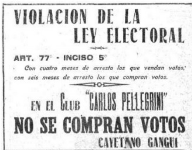
Fotografía publicada en Caras y Caretas , 1912.

Sin embargo, el elemento novedoso que el semanario remarcó de la campaña electoral de 1912 fue la incorporación de imágenes, pues en paralelo al desarrollo de carteles y pancartas textuales, aparecieron muchos que combinaban palabras e imágenes. Caras y Caretas publicó varias fotografías en las que puede observarse una gran cantidad de carteles con esas características dispuestas en los muros. (Véase Figura 5).