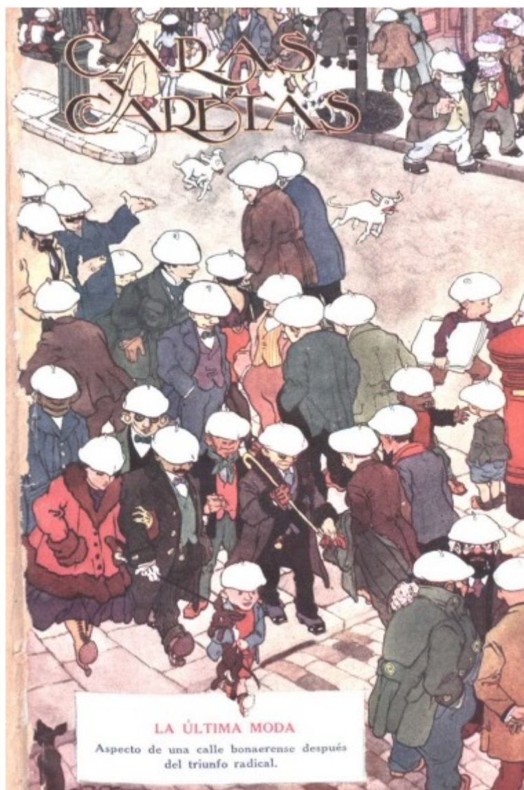
FIGURA 7 Sin firma “La última moda”

[Caricatura de portada] en semanario Caras y Caretas , 1 de julio de 1916, n.º 926, Año XIX.