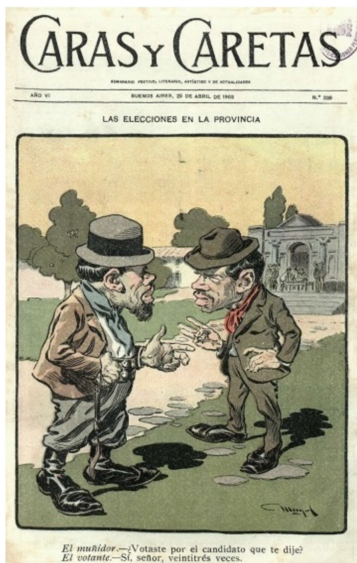
FIGURA 6 Mayol “Las elecciones en la provincia”

[Caricatura de portada] en semanario Caras y Caretas , 25 de abril de 1903, n.º 238, Año VI.