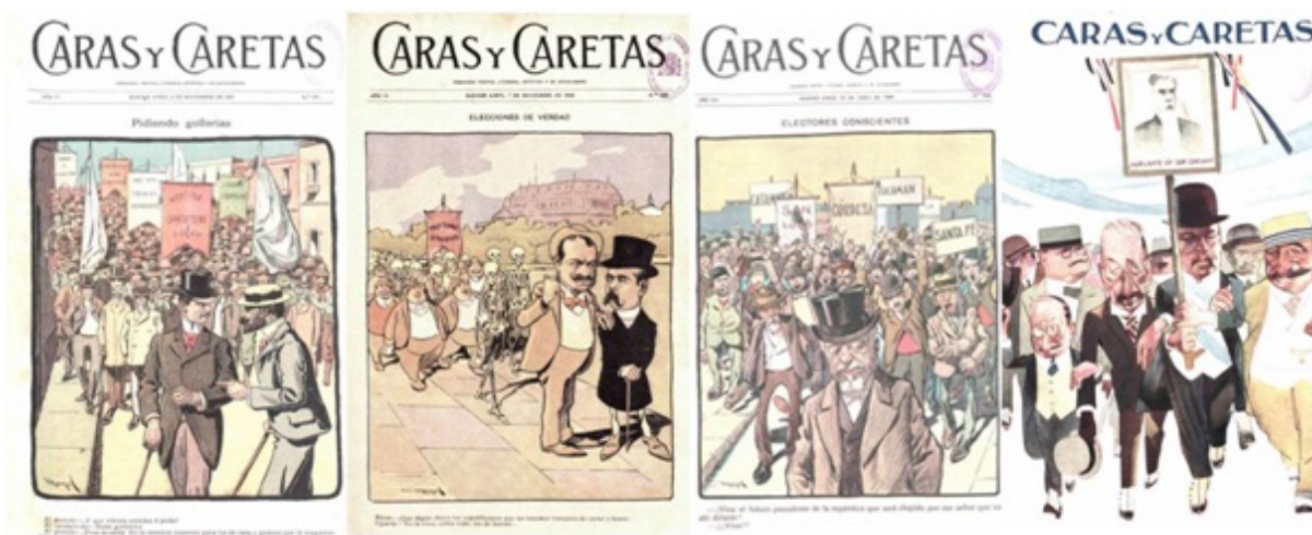
FIGURA 2 Progresión de portadas de Caras y Caretas que hacen referencia a manifestaciones (1901-1916).

Caras y Caretas presenta también una proliferación de pancartas sostenidas por simpatizantes en manifestaciones de distinto color político, como puede apreciarse en algunas caricaturas de tapa. (Véase Figura 2)