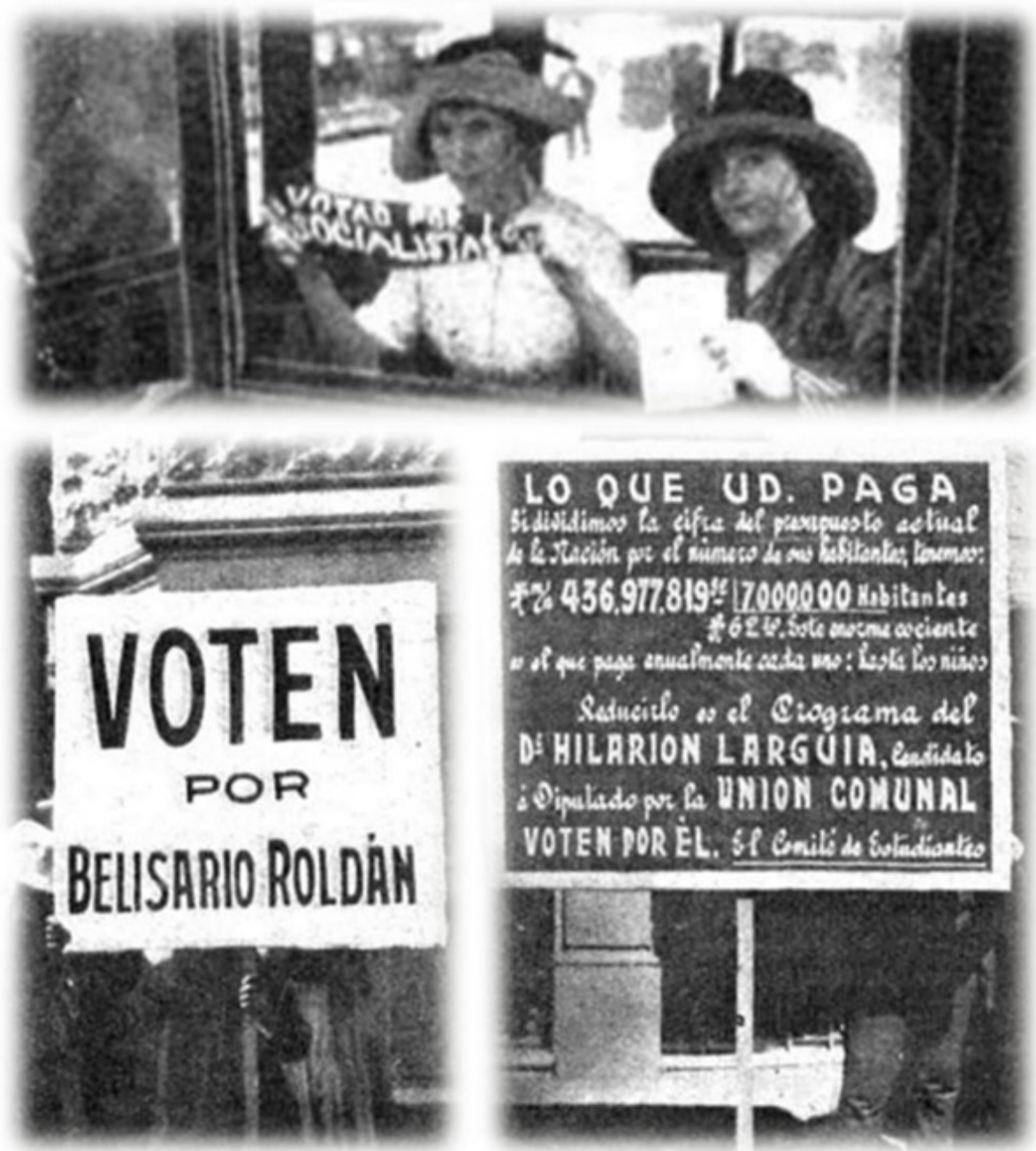
Fotografías publicadas en Caras y Caretas , 1912. (Esquema de elaboración propia).

También existían carteles compuestos por textos únicamente, como aquel colocado en el Club Carlos Pellegrini (dirigido por Cayetano Ganghi) donde podían leerse los pormenores de la violación a la ley electoral: "Con cuatro meses de arresto los que vendan votos, con seis meses de arresto los que los compren. / En el Club "Carlos Pellegrini" /NO SE COMPRAN VOTOS. /Cayetano Gangui" (sic) ("La reclame electoral" en Caras y Caretas , 13/04/1912). (Véase Figura 4).