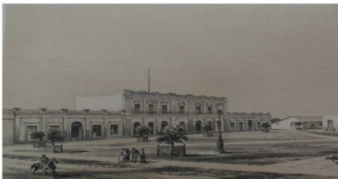
De Göering (1858) en Burmeister (1879). Adaptado de Casa del Gobierno nacional, Paraná [Litografía]. Vues Pittoresques, pl. IV fig. 7.

La plaza se constituía en el escenario de las fiestas, siguiendo la tradición instalada por Rosas para Buenos Aires. Zucchi había realizado escenografías efímeras ornamentales para las mismas. Como señala Munilla Lacasa (2009), estas desempeñaron un papel fundamental como parte de las políticas pedagógicas del Estado rosista. La fiesta de mayo en Paraná, de 1858, fue narrada por Burmeister: “En el centro de la plaza se había erigido una especie de templo de honor, imitación del famoso monumento de Lysicrates de Atenas, aunque este solo se componía de listones y de bramante blanco pintado” (Burmeister, 2008, TI, pp. 379-382). Estas habían sido realizadas por el Sr. Casanova, escenógrafo del teatro. En Paraná no se necesitaba una figura como Zucchi, Danucio no era experto en escenografías temporarias, era constructor de edificios para el gobierno, y de fachadas urbanas para la capital efímera. Las fachadas de los edificios de Danucio se constituían en el marco permanente, en esta didáctica del buen gusto que instalaba la idea del orden clásico como republicano.