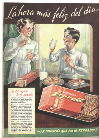
CyC , 10/6/1939

La fábrica Terrabusi publicitó asimismo en 1936 sus productos característicos (las galletitas Melba, Manon, y las obleas bañadas en chocolate Tita y Rhodesia, entre otros), con la imagen de una niña