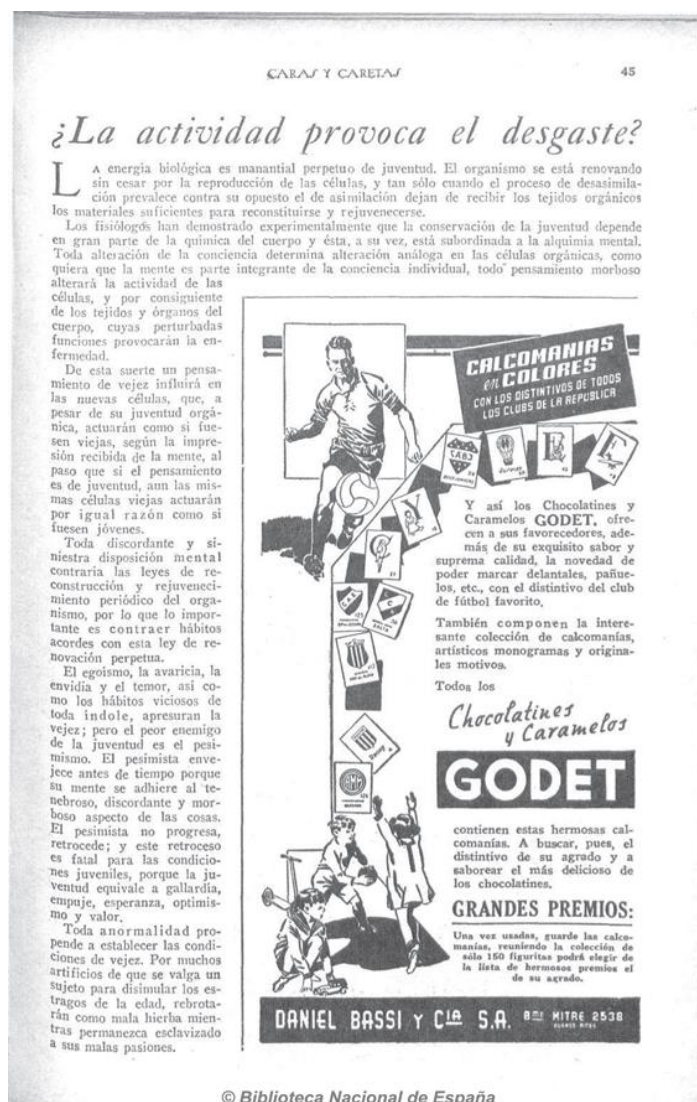
CyC, 18/9/1937: “los Chocolatines y Caramelos GODET, ofrecen a sus favorecedores, además de su exquisito sabor y suprema calidad, la novedad de poder marcar delantales, pañuelos, etc., con el distintivo del club de fútbol favorito. (...) guarde las calcomanías, reuniendo la colección de sólo 150 figuritas podrá elegir de la lista de hermosos premios.”

En efecto, la gran apuesta publicitaria de las fábricas de dulces en los años 30 fue la conquista del consumo infantil, ahora dirigiéndose directamente a los niños, y la característica saliente de esta década fue la emergencia de los niños como agentes de consumo. En ese sentido, se desarrolló una tendencia que ya había aparecido de forma incipiente en los anuncios de dulces en los años 20, en el marco de un fenómeno más amplio de emergencia de los niños como consumidores, a quienes habían apostado ya otras empresas, como es el caso de Billiken que abrió el camino de los “niños consumidores”, no sólo de lecturas sino también de otros productos (Bontempo, 2012, 2015; Scheinkman, 2017b). De forma novedosa, las publicidades del periodo se destinaron y dirigieron ya no a las madres, sino directamente a los niños como sujetos de consumo a los que era necesario conquistar. En 1938, en el diario ilustrado El Mundo , Nestlé hablaba directamente a los niños lectores: “Chicos: Uds. pueden ganarse una magnífica bicicleta de premio tomando parte en el concurso de Agosto de los Chocolatines Nestlé” (Imagen 6). Pocos años después, los chocolatines Águila se publicitaban de la misma manera: “Chicos!!! El chocolatín Águila les ofrece las estampillas más maravillosas del mundo... el más interesante e instructivo de los pasatiempos” (Imagen 7). Si por un lado las publicidades esperaban estimular los deseos de los pequeños, y por su intermedio, influir en el gasto familiar provocando la compra,