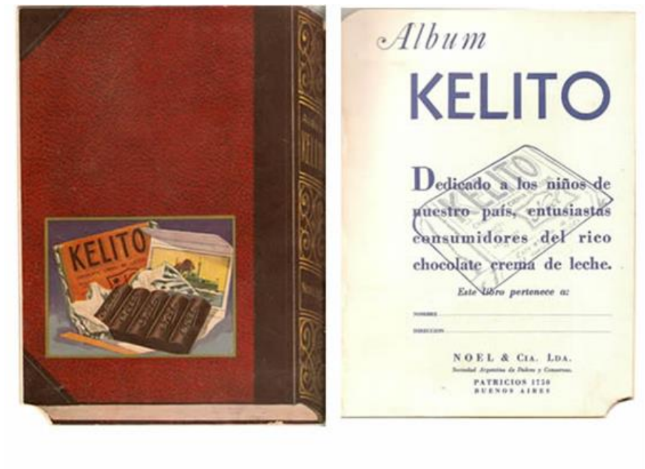
Noel y Cía. Álbum Kelito , 1932.

En 1936, la fábrica Noel apostaba también fuertemente a los chocolatines infantiles, colocando la publicidad de los “Kelito” en la portada de su catálogo de productos y precios corrientes de dicho año. La empresa se comprometía a sortear 2 pequeños autos por mes y 200 premios de $5 m/n cada uno entre los consumidores. Estos novedosos premios prometían atraer más consumidores que nunca, y con ese anzuelo los fabricantes esperaban que los almaceneros y comerciantes al por menor sugirieran los productos exhibiéndolos vistosamente: “Nunca venderá Ud. Más chocolatines que este año si se provee de “KELITOS” y se preocupa de exhibir los carteles y distribuir los prospectos que le mandaremos, con fotos de los autos y las bases del concurso” (Imagen 11). En 1932, el álbum Kelito, “dedicado a los niños de nuestro país, entusiastas consumidores del rico chocolate crema de leche” fue sobre clubes de fútbol. Las calcomanías eran ilustradas con los jugadores más reconocidos, y el desafío era completar los equipos (Imagen 12) 18 .