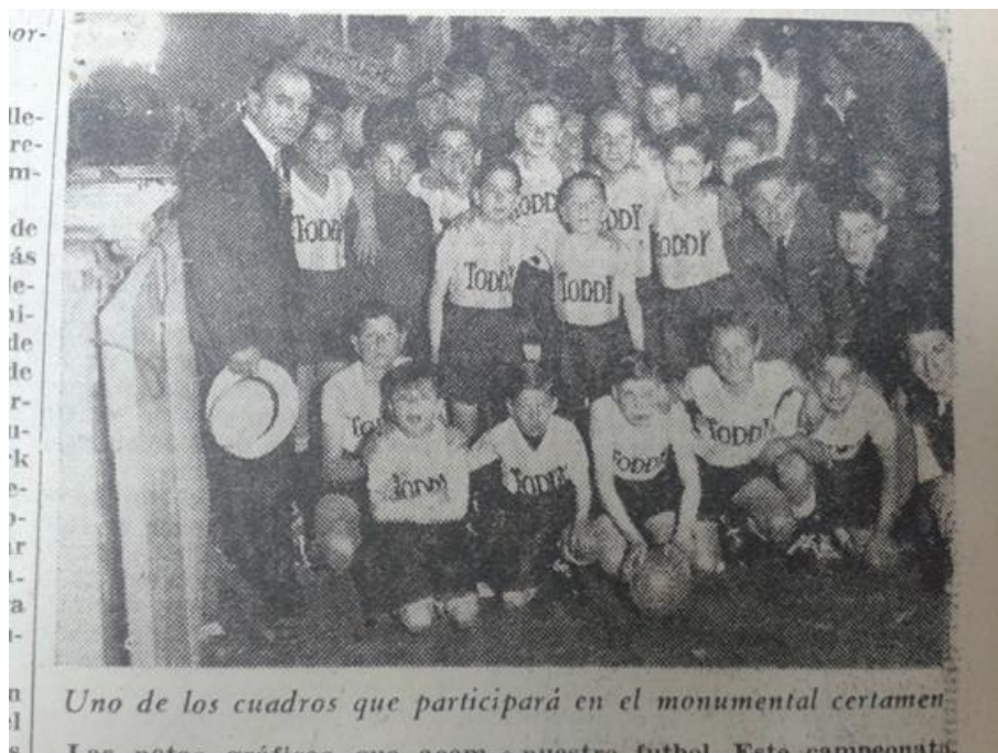
Gran Campeonato Toddy.

“Campeonato Toddy”, La Hora , 24/11/1941.